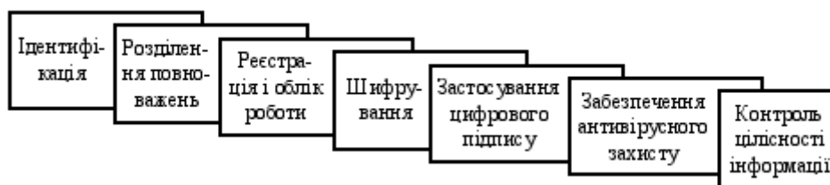
Рисунок 3. Основні правила забезпечення політики безпеки інформації

Основною ціллю реалізації політики безпеки є забезпечення ефективного функціонування компанії, для чого необхідно забезпечити захист оброблюваної на підприємстві інформації від несанкціонованого доступу. Політика безпеки має на меті розробку та впровадження правил та норм внутрішнього режиму праці на підприємстві, режиму доступу та допуску до важливих об'єктів, їх охорона, середовище розміщення